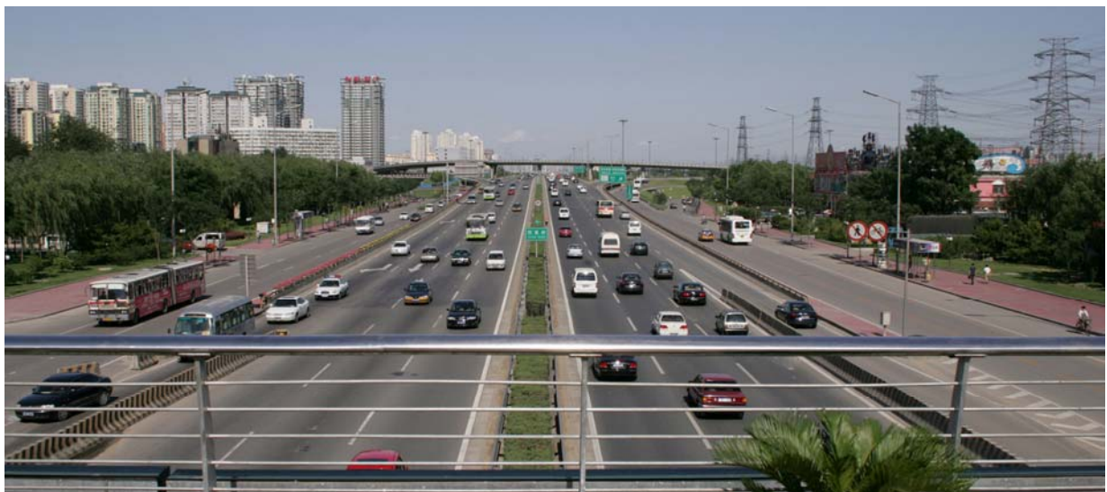
An Straßen mangelt es nicht in Peking

Klimaproblematik vor Ort in den Griff zu bekommen. So wurden im Vorfeld der Spiele eine Million Fahrzeuge sowie emissionsträchtige Fabriken testweise stillgelegt, um zu überprüfen, wie sich das akut auf das Klima auswirkt.