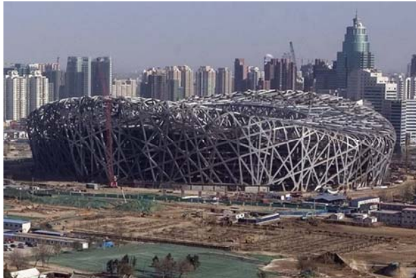
Das neue Nationalstadion in Peking

noch einmal verdoppelt haben. Über alle Disziplinen hinweg werden wieder ca. 110 Athleten, das sind etwa 25 Prozent der gesamten Olympiamannschaft, in sportübergreifenden Betreuungsbereichen durch den OSP Frankfurt-Rhein-Main vorbereitet werden.