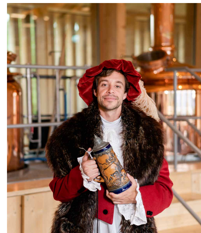
Tobi als Erfinder des Reinheitsgebots.