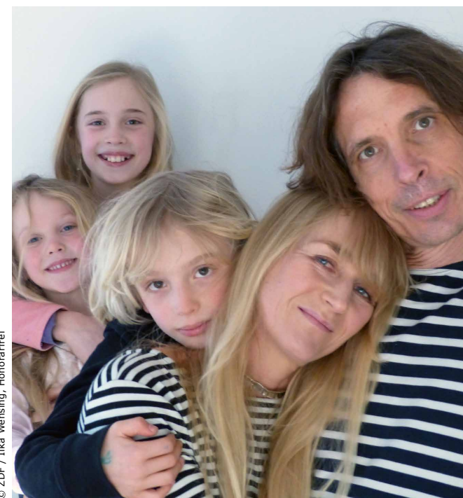
„pur+“ macht das Zucker-Experiment.

Zucker schmeckt herrlich süß, aber ist nur in geringen Mengen gesund. Die Lebensmittelhersteller*innen stört das nicht: Sie verwenden deutlich mehr Zucker als nötig und machen uns dadurch süchtig. Das hat Folgen: Kinder, aber auch Erwachsene, werden immer dicker. Im „pur+“-Experiment versucht eine Familie eine Woche lang nur die Hälfte ihres normalen Zuckerverbrauchs zu konsumieren. Welche Lebensmittel sind erlaubt? Schmecken sie? Fehlt ihnen „süß“? Zucker ist billig, konserviert Marmelade, lässt Hefeteig aufgehen und sorgt für eine knusprige Bratenkruste. Doch Zucker steckt oft auch in Lebensmitteln und Getränken, wo wir ihn gar nicht vermuten.