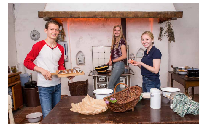
Die Jugendlichen kochen mit Uromas Küchengeräten.

Montag, 7. September bis Donnerstag 10. September und Montag, 14. September bis Donnerstag 17. September, jeweils um 19:25 Uhr