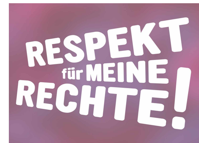
Dieses Jahr findet der Weltkindertag digital statt.