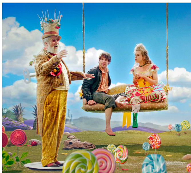
Das Märchen vom Schlaraffenland.