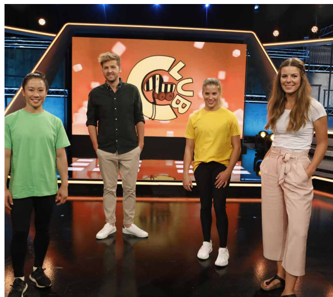
Kunstturnerinnen zu Gast beim „Tigerenten Club“.